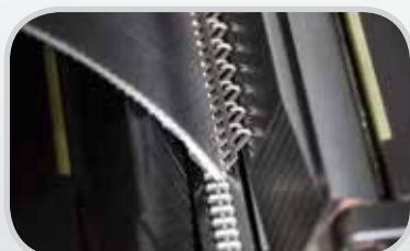
Grapas de producción Clipper®, el método más rápido y más preciso para la instalación de alto volumen de engrapado G Series™