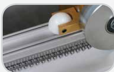
Grapas de mantenimiento Clipper®, rápida instalación en el lugar de engrapado G Series™ con Roller Lacing Technology™ de precisión