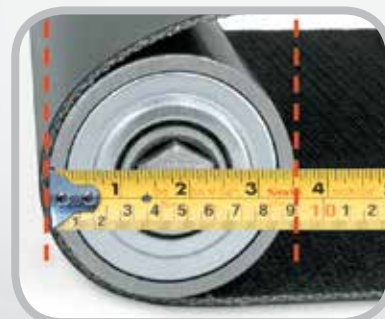
Mida el diámetro de la polea más pequeña