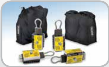
Mordazas para banda Smart Clamp™