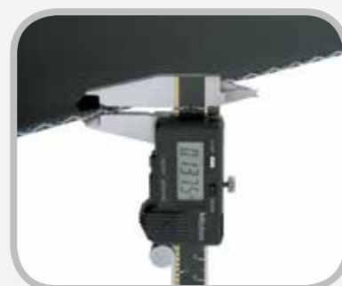
Mida el espesor de la banda