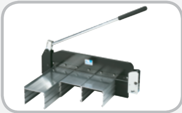
Cortador de banda de 14"