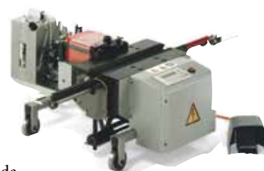
Se muestra: Pro 6000

Las grapas de producción Pro Series incluyen nuestra acción de mordaza patentada, el peine, ganchos y banda se jalan simultáneamente a medida que las mordazas comprimen los ganchos en la banda, formando un perfil óptimo del gancho.