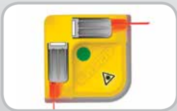
Laser Belt Square