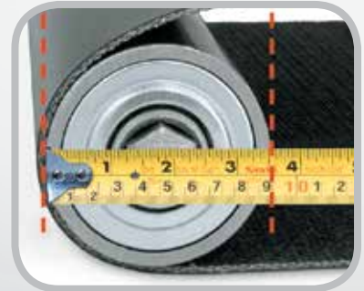
測量最小滾筒直徑。