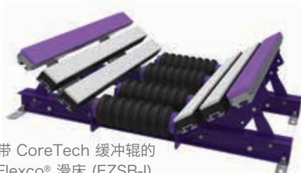
带 CoreTech 缓冲辊的 Flexco® 滑床 (EZSB-I)