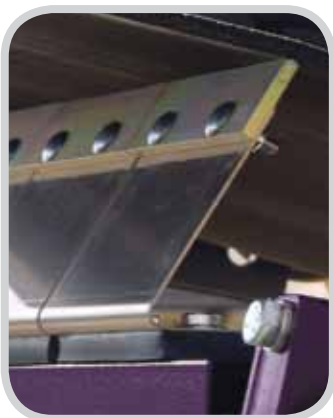
Einzigartige FormFlex™-Schwingungsdämpfer sind einzeln gelagert und drücken die Abstreifblätter automatisch an das Band.