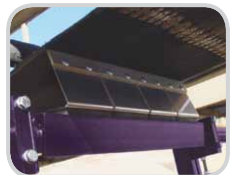
Verschleißarme Hartmetall-Abstreifblätter halten bis zu einem Jahr oder länger in vielen Anwendungsfällen

Der Abstreifer kann an jeder Stelle im Untertrum montiert werden, nach dem das Band die Kopftrommel verlassen hat. Bei beengten Platzverhältnissen genügt ein Einbauraum von 225 mm in der Vertikalen und 100 mm in der Horizontalen.